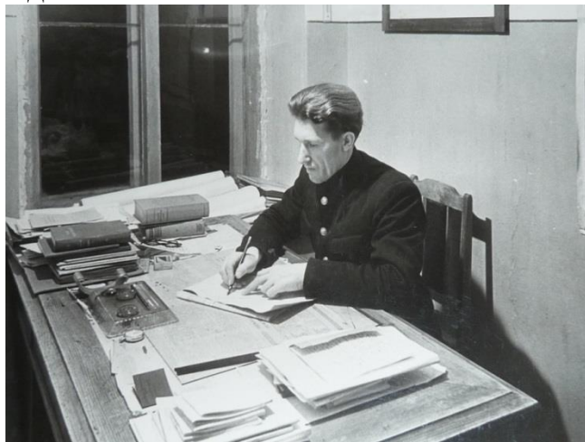
В кабинете за работой. Первые послевоенные годы.

С 15 декабря 1945 года был назначен директором средней школы № 2 им В.И. Ленина и проработал в этой должности до выхода на пенсию 5 августа 1971 года.