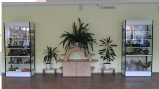
зоны детских фантазий