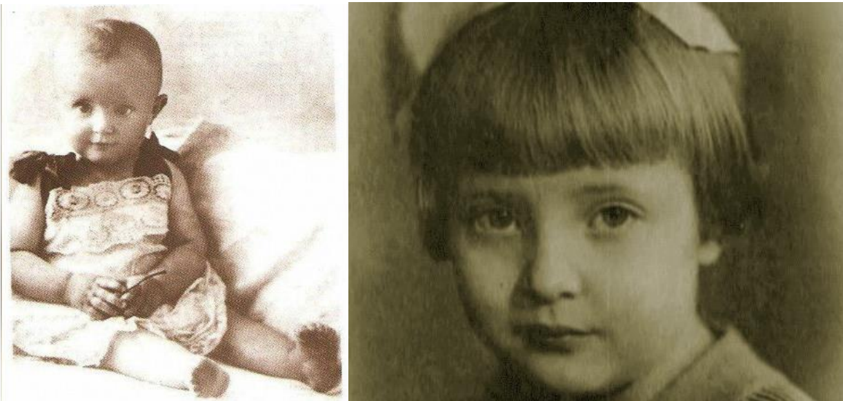
Татьяна Доронина в детстве.